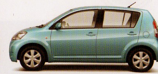
Mint Blue metallic opal