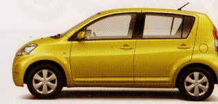
Yellow Green Mica metallic